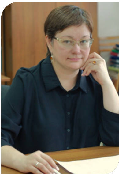
Кандидат технических наук. Доцент.