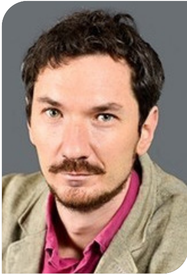
BIM-менеджер/ координатор, цифровой лидер.