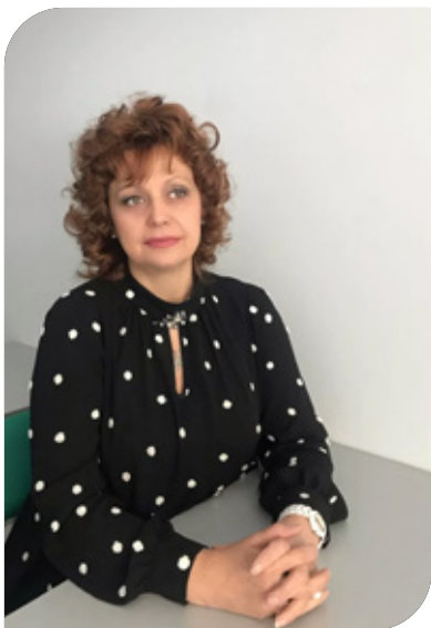
Кандидат экономических наук, доцент.