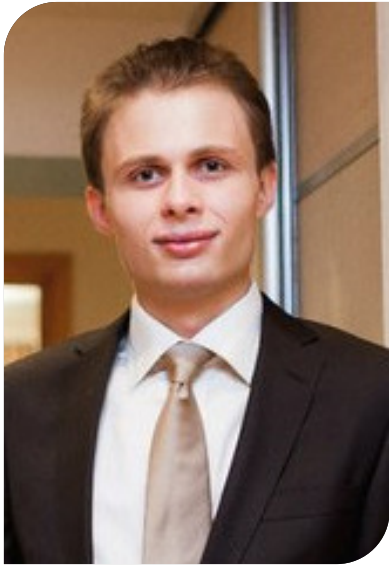
Главный специалист конструктор, BIM менеджер.