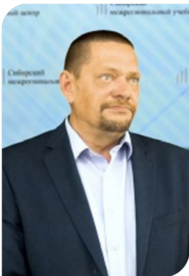
Бизнес-консультант, Директор ООО «Протект Бизнес Ресурс».