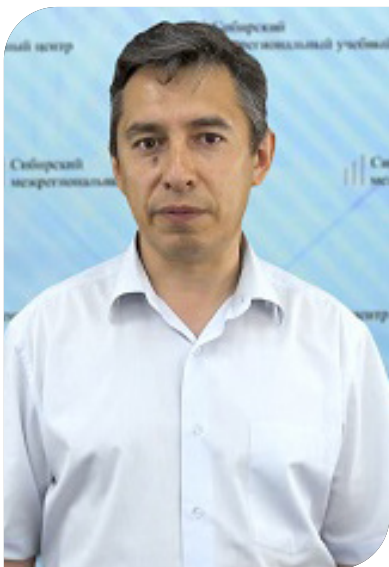
Главный технический инспектор труда.