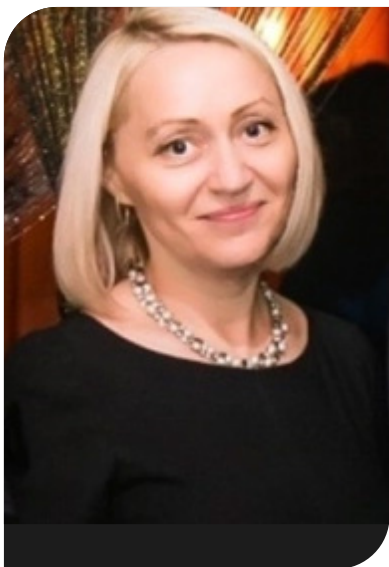
Доцент кафедры экономики и организации отраслей лесного комплекса.